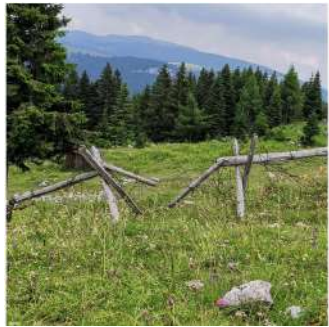
Altopiano di Asiago

Ricerca e divulgazione scientifica e letteraria con tutte le Università della RdV e incontri con gli Autori