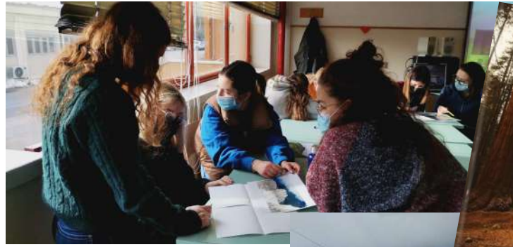
workshop interattivi con + di 40 classi