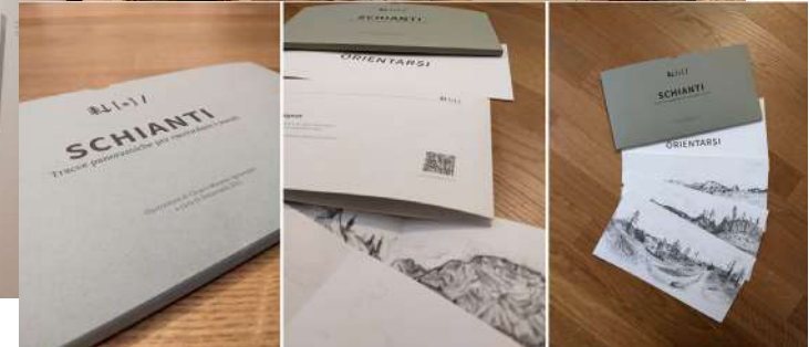
SCHIANTI - la pubblicazione dei disegni interattivi

AZIONE 1: La sfida per i giovani: creare un gioco e un dossier di viaggio spazio-temporale