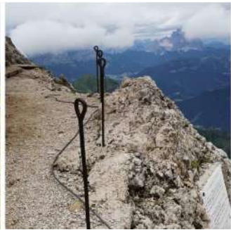
Dolomiti bellunesi, Marmolada